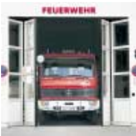
■ AS Aluminium- Schnellauf-Falttor