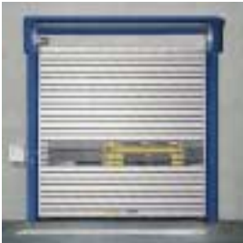
■ SST Schnellauf-Spiraltor

■ Weitere Informationen im Internet: www.efaflex.com oder einfach per Fax anfordern: 08765/82-100