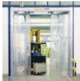
■ ES Elastik- Schnellauf-Falttor