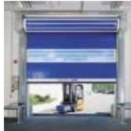
■ STR Schnellauf-Turbo-Rolltor