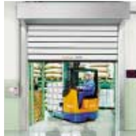
■ SST-ISO-K Schnellauf-Spiraltor k-Wert = 0,5 W/m 2 K