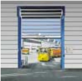
■ STT Schnellauf-Turbotor