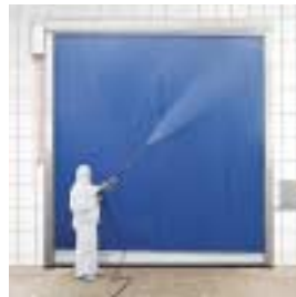
■ SRT-EC Schnellauf-Rolltor Lebensmittel- und Hygienebereich