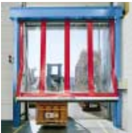
■ SRT Schnellauf-Rolltor