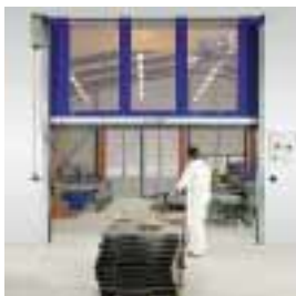
■ SRT Schnellauf-Rolltor