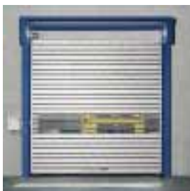
■ SST Schnellauf-Spiraltor

■ Weitere Informationen im Internet: www.efaflex.com oder einfach per Fax anfordern: 087 65 / 82-100