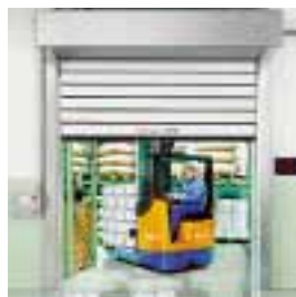
■ SST-ISO-K Schnellauf-Spiraltor k-Wert = 0,5 W/m 2 K