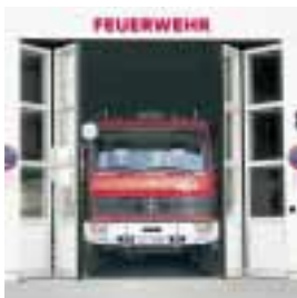
■ AS Aluminium- Schnellauf-Faltdor