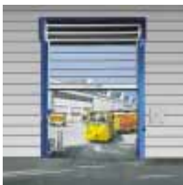
■ STT Schnellauf-Turbotor