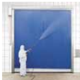
■ SRT-EC Schnellauf-Rolltor Lebensmittel- und Hygienebereich