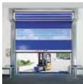
■ STR Schnellauf-Turbo-Rolltor