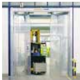
■ ES Elastik- Schnellauf-Faltdor