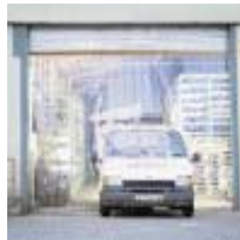
■ SV Streifenvorhang