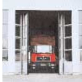
■ AS Aluminium-Schnellauf-Falttor