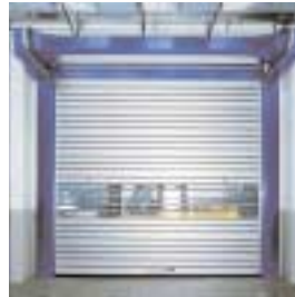
■ SST Schnelllauf-Spiraltor