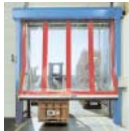
■ SRT Schnelllauf-Rolltor