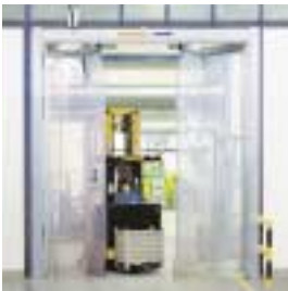
■ ES Elastik-Schnellauf-Falttor