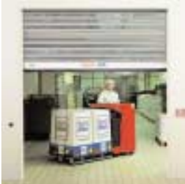
■ STT Schnelllauf-Turbotor