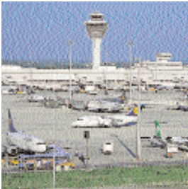
■ Tore die Karriere machen

■ Weitere Informationen im Internet: www.efaflex.com oder einfach per Fax anfordern: 08765/82-100