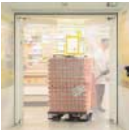
■ PT Pendeltor